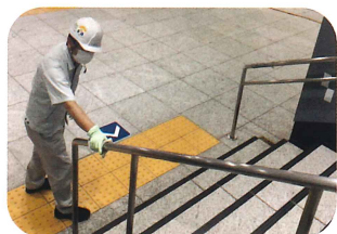
東京メトロ 駅構内