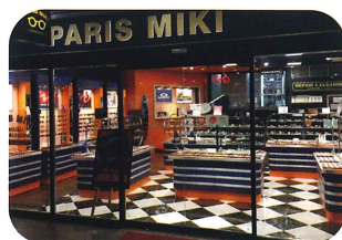
メガネのバリミキ