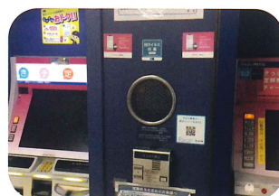
東京メトロ 券売機