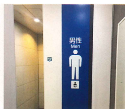
東京メトロ トイレ