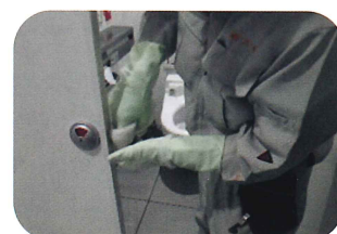
東京メトロ 駅構内