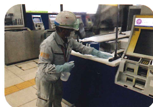
東京メトロ 駅構内