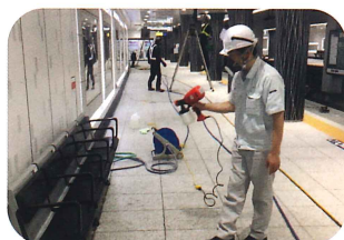
東京メトロ 駅構内