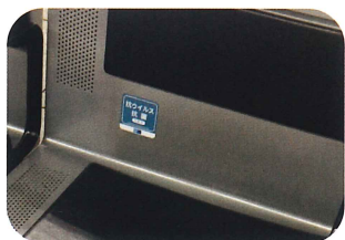
東京メトロ ベンチ