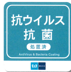
抗ウイルス・抗菌処置済を示すステッカー(イメージ)